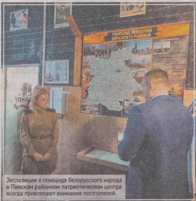
Экспозиции о геноциде белорусского народа в Пинском районном патриотическом центре всегда привлекают внимание посетителей.