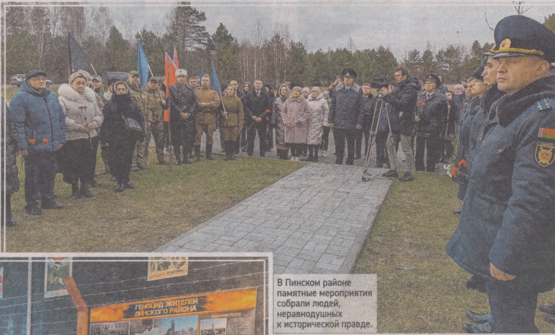
В Пинском районе памятные мероприятия собрали людей, равнодушных к исторической правде.

вали группировки украинских националистов УПА и ОУН, которые пересекли условную границу нынешней Беларуси и Украины. Одна из группировок — под командованием бандита по прозвищу Хмара. Они и совершили злодеяние.