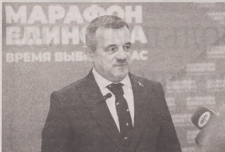
Председатель Пинского городского исполнительного

Два дня – 8 и 9 ноября – Пинск гостеприимно принимал «Марафон единства». Республиканская общественно-культурная акция стала по-настоящему народной. Она объединяет белорусов, дарит отличное настроение, знакомит с интересными людьми, оставляет запоминающийся след в жизни города, в котором он проходит. Марафон в столице белорусского Полесья отличался от предыдущих. Организаторы отметили его особый полесский колорит. Не раз вспоминалась знаменитая фраза: «Па-першае, я з Пінска».