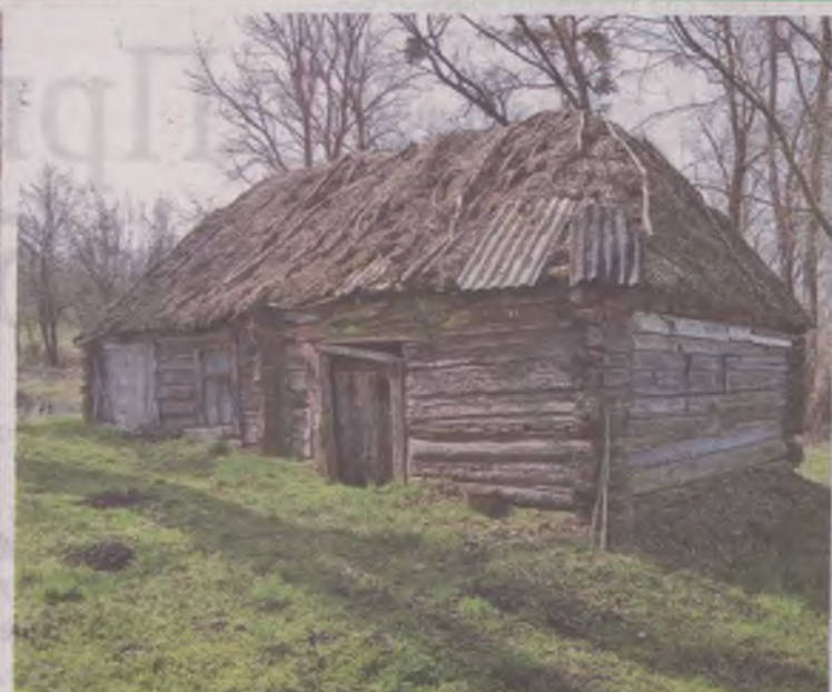
Здесь уже давно нет хозяев