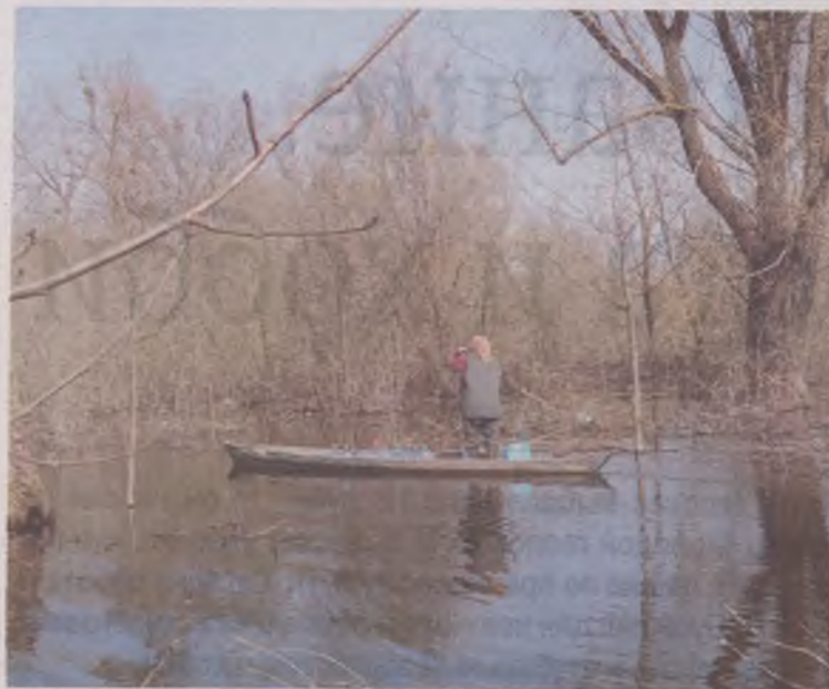
Чайкой – на заречные огороды

Деревня Кудричи приютилась в самом сердце белорусского Полесья на берегу Ясельды, название которой с санскрита переводится как «река богов». Только какие силы занесли первых поселенцев в этот истине забытый Богом болотистый уголок, остается загадкой.