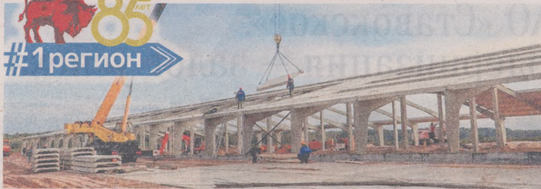
Строительство молочно-товарного комплекса ООО «Стисхо Пинское», д. Чамля Пинского района.