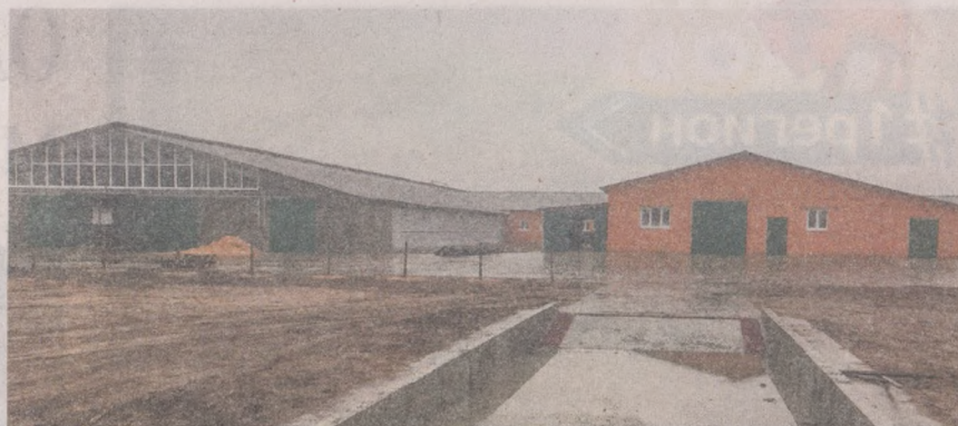
Строительство молочно-товарной фермы, д. Горново Пинского района.