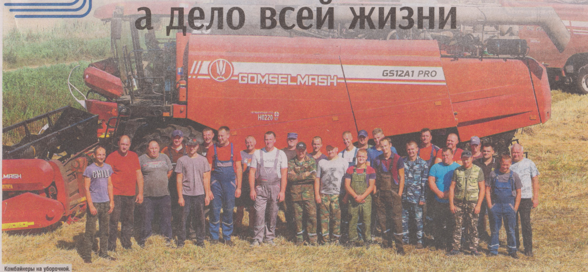
Комбайнеры на уборочной.

У тружеников ОАО «Парохонское» Пинского района не так много времени для отдыха и развлечений. Работа на земле или в животноводстве для них не просто заработок, а дело всей жизни, которому они полностью отдают себя. Не удивительно, что благодаря этим простым надежным людям хозяйство много лет уверенно занимает лидирующие позиции в агропромышленном комплексе страны.