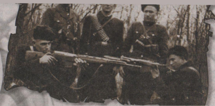
Оуновцы в лесах Брестчины.

шхувачу, прасявали зброю через кордон і т. ін. В завершение напомним, с каким лозунгом, провозглашенным Романом Шухевичем, встретили украинские националисты 9 мая 1945 года: «Домагатися, щоб ні одне сіло не визнало радянської влади. ОУН має діяти так, щоб усі, хто визнав радянську владу, були знищені. Не залякувати, а фізично знищувати! Не потрібно боятися, що люди проклянуть нас за жорсткість. Хай із 40 мільйонів українського населення залишиться половина — нічого страшного в цьому немає».