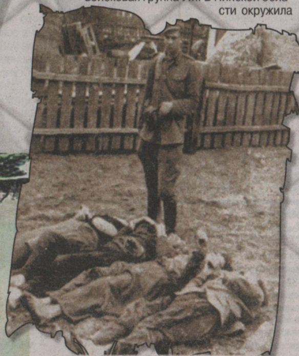
Украинский каратель на фоне убитых им белорусов.