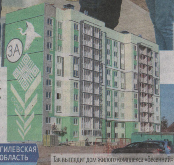
Так выглядит дом жилого комплекса «Весенний».

80 — под долевое строительство. Это долгожданное событие для новоселов. И вообще, появление в пригороде многоэтажки с лифтом стало пилотным в области. В новом жилом комплексе «Весенний» скоро возведут еще четыре комфортных многоквартирных дома. Жильцы дома 3А по улице Пинская очень довольны. Менее чем за год его построил КУП «Брестжилстрой», а застройщиком был УКС Пинска.