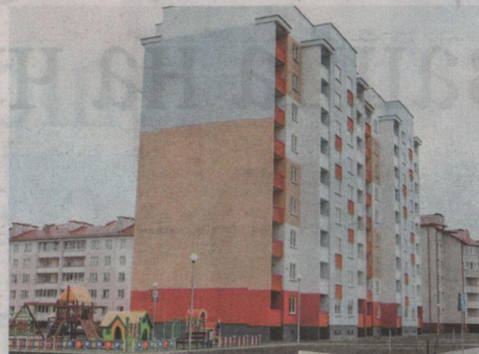
Возведение в Дятлово современного девятиэтажного дома позволило многим многодетным семьям отпраздновать новоселье.