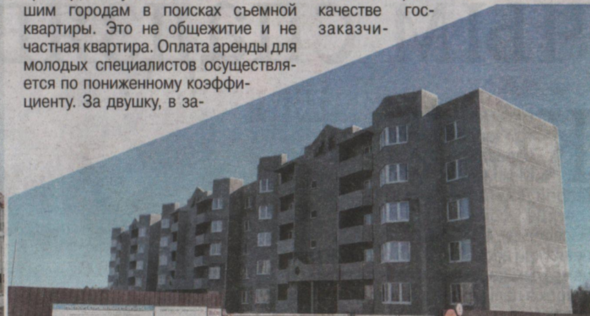
Строительство многоквартирного жилого дома в деревне Красная Слобода Минского района.

А в лидерах по строительству многоквартирных и частных домов остается Минский район. В качестве госзаказа-