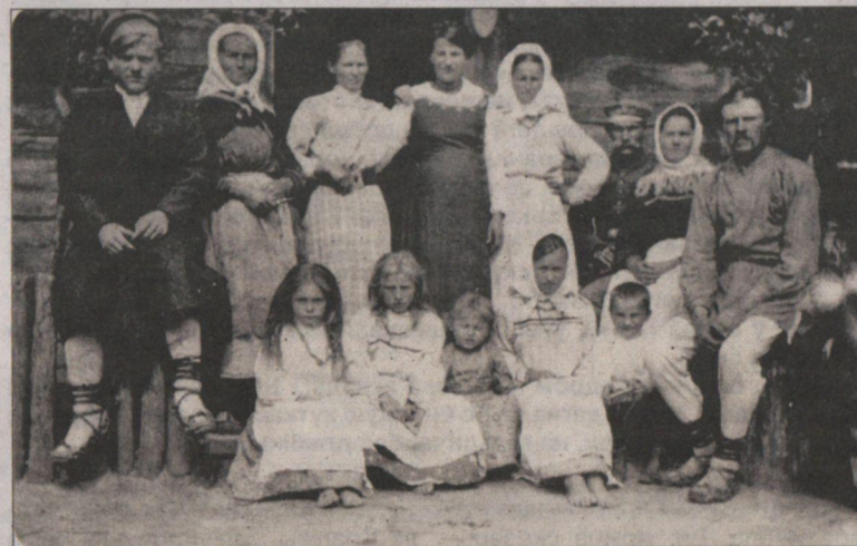
Дабраволя. Свіслацкі р-н. Мясцовыя жыхары.