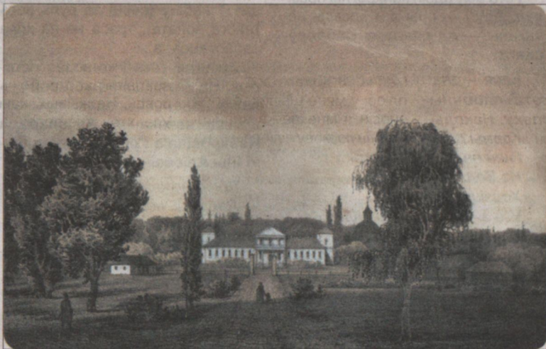
Дубае. Пінскі р-н. Сядзіба.

коў, што яны захоўваліся ў архі- вах старэйшых сямейнікаў. Многія паштоўкі сталі рэпрадукцыямі ў кнігах. Паступова, за многія гады, выбудалася цэлая бібліятэка. Дзя- куючы паштоўкам я прайшоўся адрасамі праваслаўных храмаў, узнавіў усялякую інфармацыю пра падзеі Першай сусветнай вайны ў Беларусі. Розгалас выклікалі аль- бомы «Беларусь шматнацыяналь- ная», «17 верасня. Дзень народ- нага адзінства». Да рэпрадукцый старых паштовак я дадаў і іншыя ілюстрацыйныя, дакументальныя матэрыялы. У прыватнасці, дату 17 верасня 1939 года, жыццё бела- русаў пад прыгнётам палякаў у міжваенны перыяд паказаў з да- памогай старых газет.