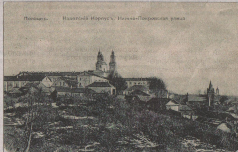
Полацк. Від з Замкавай гары на кадэцкі корпус.

кі розных часін, а часам і старыя паштоўкі, прысвечаныя сваёй мяс- цовасці. І цяпер, калі па ўсёй краіне разгортваецца праект «Бацькаў- шчына», з'яўляецца магчымым ажывіць гэтыя экспазіцыі, далучыць рэпрадукцыі мясцовых збораў да друку ў рэгіянальных і рэспублікан- скіх выданнях. А чаму б, напрыклад, не абвясціць і пэўны конкурс работ школьнікаў, моладзі як сачыненняў ці эсэ з каментарыямі да візуальна- га, ілюстрацыйнага матэрыялу пра сваю мясцовасць?.. Гэта ж усім нам, і журналістам, і калекцыянерам, і моладзі, школьнікам, дапаможа больш пільна ўгледзецца ў малую і вялікую гісторыю Айчыны. Дапа- мога зрабіць свае ўласныя, прыват- ныя адкрыцці галоўных ісцін жыцця, дадасць пачуцця павагі да здзяйс- ненняў папярэднікаў. Нагадае, які маштаб любові, сыноўскіх пачуццяў мы проста абавязаныя аддаць, скі- раваць да роднай старонкі, да на- шай Айчыны, да Бацькаўшчыны... «Зноў вясна, і жаль знікае зноў. / (Так губляюць пах перад вясной /