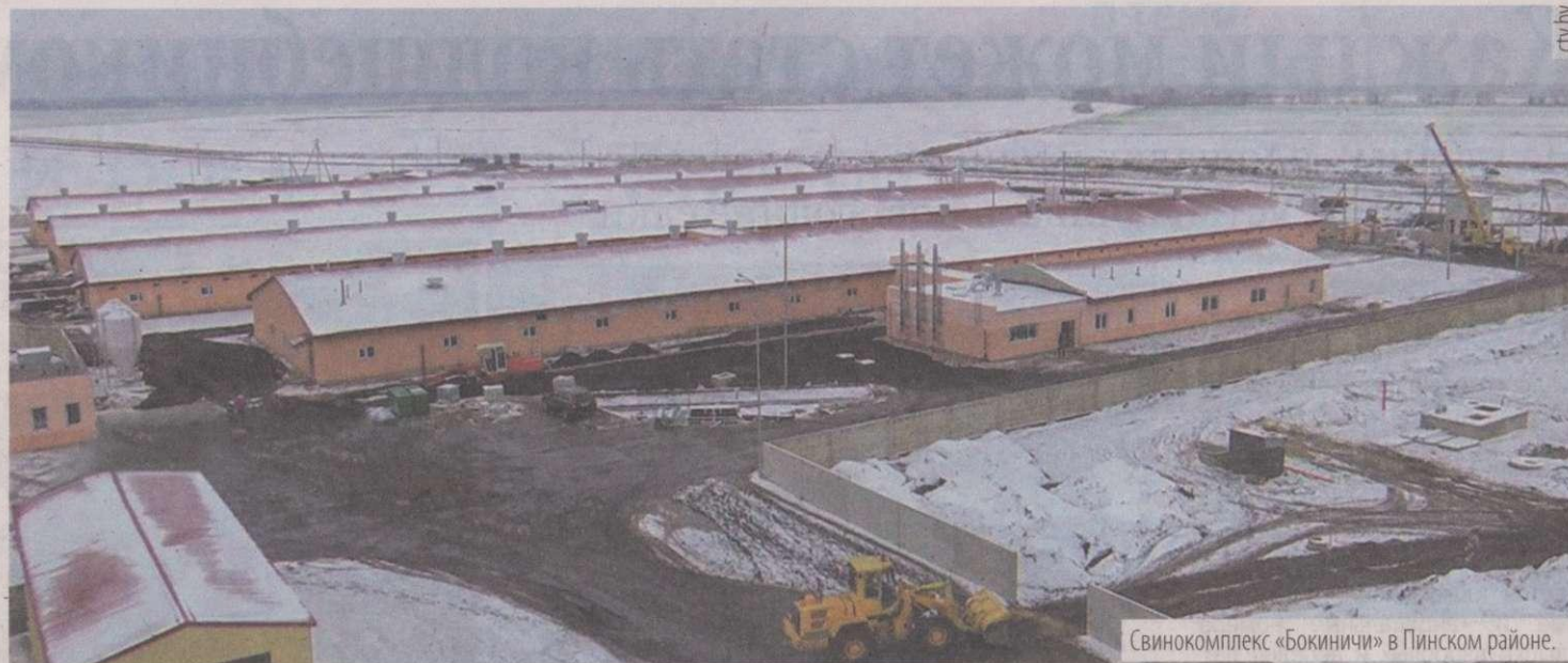
Свинокомплекс «Бокиничи» в Пинском районе.