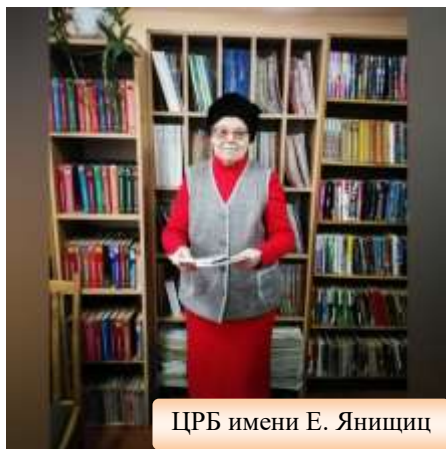
ЦРБ имени Е. Янищц