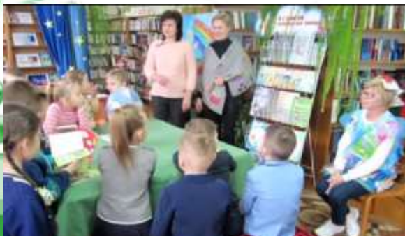
3 место - Молотковичская сельская библиотека