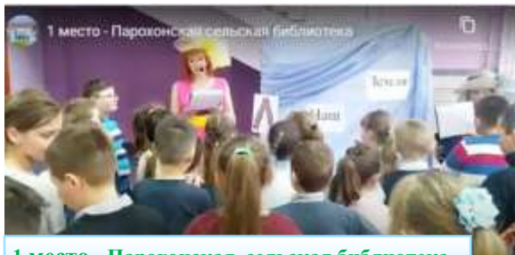
1 место– Парохонская сельская библиотека