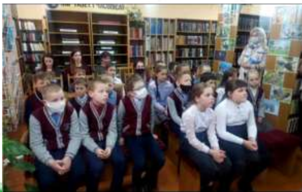
2 место-ЦРБ имени Е. Янищиц