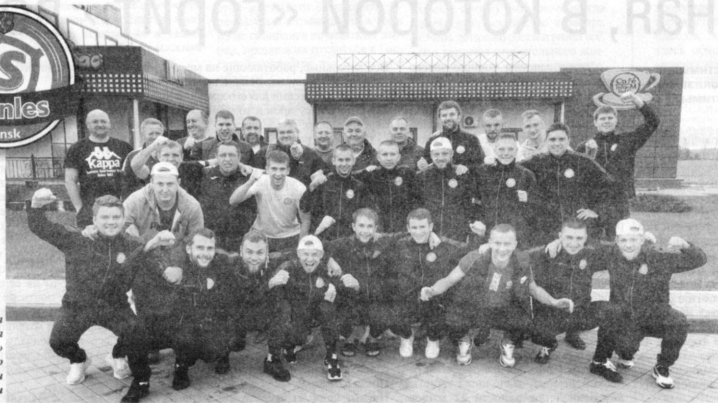
Футбольная команда «Стэнлес» вместе со своими создателями