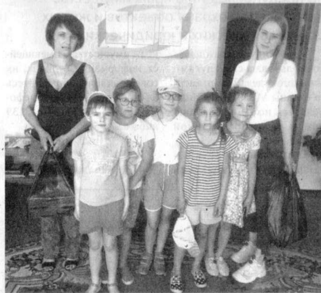
Профсоюзный актив райпо навещал ребят из городского социально-педагогического центра.