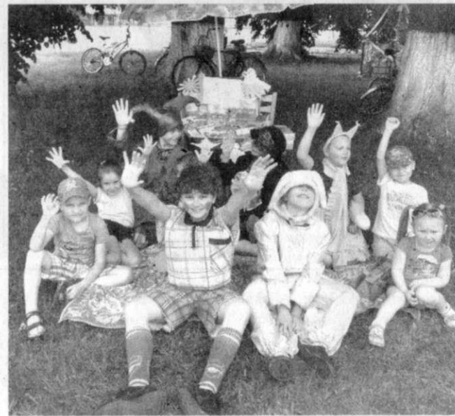
Кошевичи: «Мир всем детям на планете!».