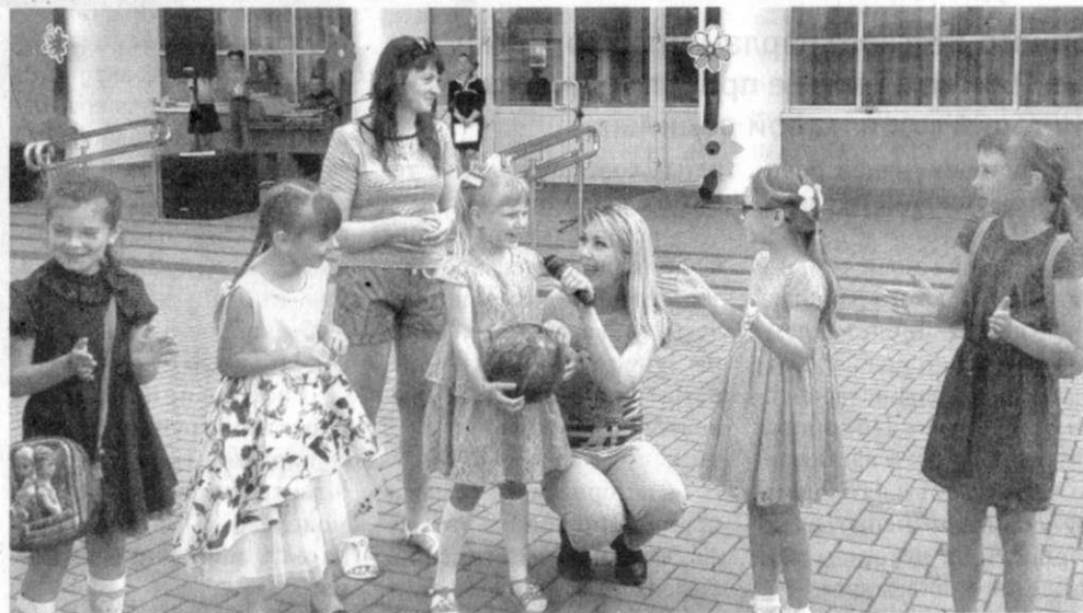
Праздник для детей организовали в Логешине.