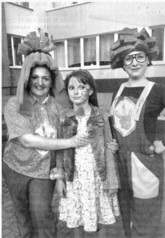
Сказочные персонажи развлекали ребят в Парохонске.