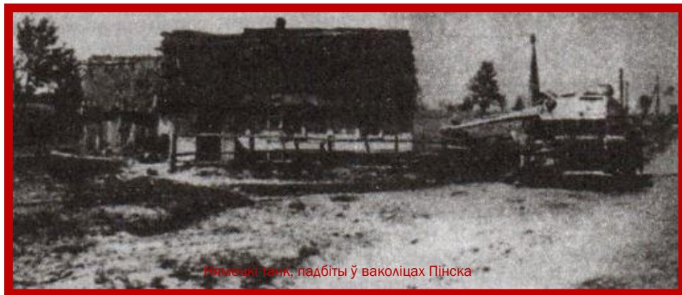
Немецкі танк, падбіты ў ваколіцах Пінска

3 поўдня да Пінска з баямі прабіваліся 12-я і 212-я стралковыя дывізіі, якія ўваходзілі ў склад 9-га стралковага корпуса 61-й арміі. Ноччу 10 ліпеня 29-ы стралковы полк 12-й стралковай дывізіі фарсіраваў Прыпяць у трох кіламетрах ад в. Вялікія Дзіковічы і захапіў невялікі плацдарм на яе левым беразе. Амаль тры дні ішлі жорсткія баі за гэты невялікі кавалачак зямлі. Толькі на наступны дзень, атрымаўшы дапамогу, полк уварваўся ў вёску. Спробы фашыстаў адбіць яе не прынеслі поспеху, нягледзячы на 30 контратак.