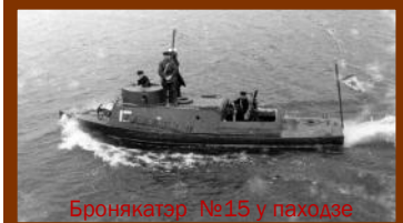
Бронякатэр №15 у паходзе