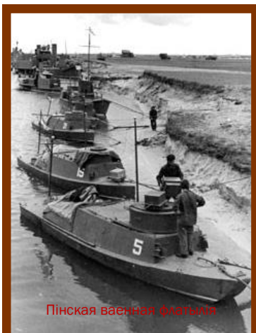
Пінская ваенная флатылія