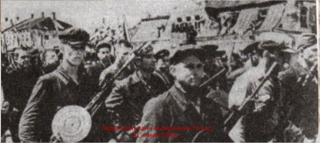
Парад партызан у вызваленым Пінску. 21 ліпеня 1944 г.

Войскі 164,166 і 168 палкоў 55-й гвардзейскай стралковай дывізіі