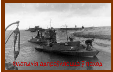
Флатылія адпраўляецца ў паход

У Пінску размяшчаўся штаб Пінскай ваеннай рачной флатыліі, якая складалася з атрада глісераў, групы кананерскіх лодак, дывізіёнаў бронякатэраў, манітораў, тральшчыкаў, а таксама вартавых караблёў, міннага загаджальніка і зенітнага артылерыйскага дывізіёна.