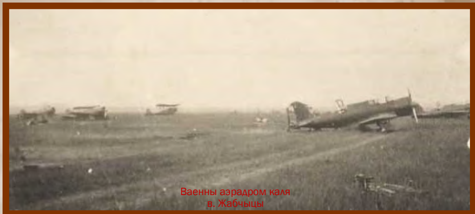
Ваенны аэрадром каля в. Жабчыцы

“...З-за адсутнасці боепрыпасаў вымушаны быў пакінуць 5 ліпеня горад”, - пісаў у данясенні камандарму генерал С.І.Нядзвігін. Мужна змагаліся з ворагам савецкія лётчыкі. Да 25 чэрвеня з Жабчыцкага аэрадрома падымаліся ў паветра бамбардзіроўшчыкі: самалёты 39-га палка выляталі на згішчэнне ворага, наносілі ўдары па яго калонах, якія рухаліся на Маскву.