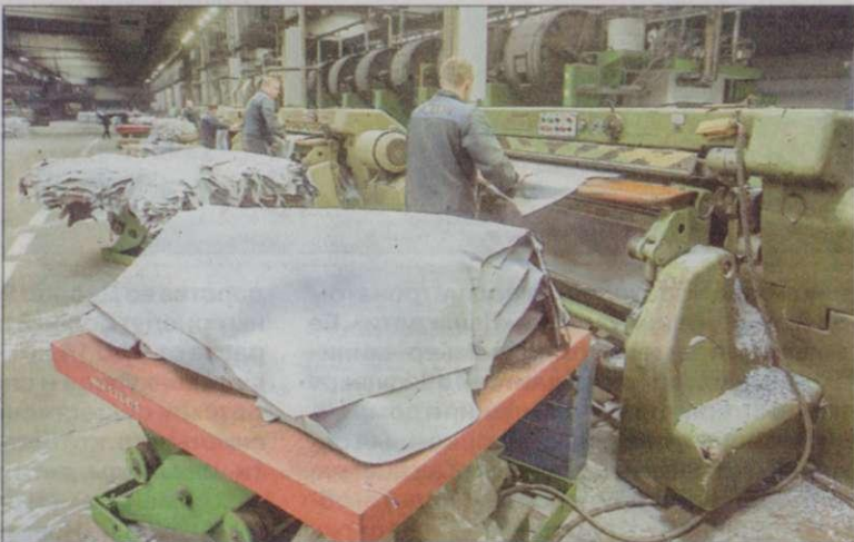
Кожевенное предприятие в Гатово построено 30 лет назад по итальянскому проекту и являлось одним из лучших в СССР. Но успешно работать сегодня ему мешает обилие посредников...

Раньше эта разница отправлялась в доход посреднику. Рекорды финансовой ловкости поставила Орша. Одна лишь сделка — и 400 тысяч долларов в кармане. Регион и без того успехами не блещет. Но вот «Оршаагропромаш» — завод с большой историей. Здесь решили запустить в производство новые агрегаты, закупили конструкторские документы. Цена сделки — почти 450 тысяч долларов. При этом фирма-изготовитель оценила свою работу в 10 раз дешевле.