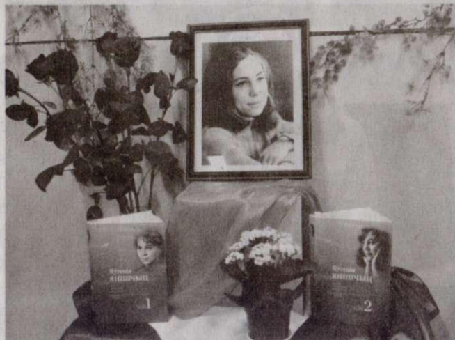
Кніжна-ілюстрацыйная выстава, прысвечаная Я. Янішчыц.