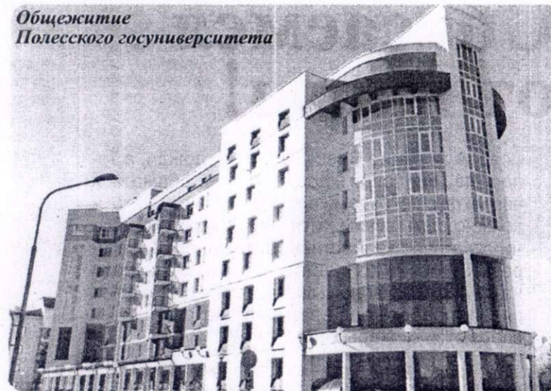
Общезжитие Полесского госуниверситета

лики. Бралась за любые объекты, невзирая на свой сельскохозяйственный профиль, став в итоге универсалами на рынке оказания строительных услуг. Этот козырь и объясняет нынче широкий тематический диапазон заказов «Пинсксовхозстрой». А тогда как рядовые строители, так и руководители всех рангов поддерживали такую стратегию, не отказывались от дальних длительных командировок, старались не подвести, осваивали специфику новых для них заказов. Ведь на кону стояла судьба треста, от которой зависело благополучие