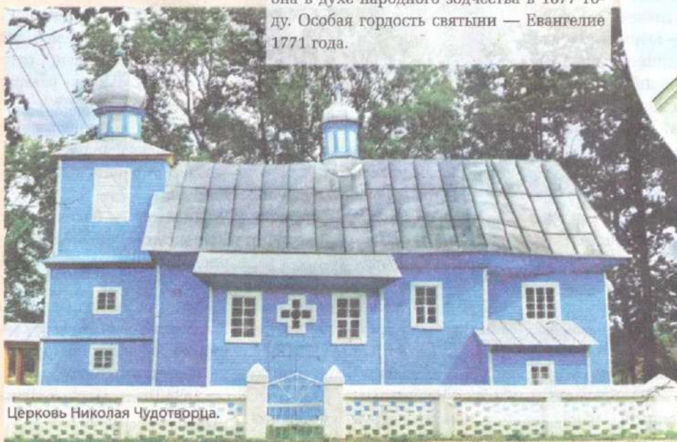
Церковь Николая Чудотворца.

Имение впервые упоминается в конце XIV века как собственность Наримунтовича. Деревню украшает деревянная церковь Святого Николая Чудотворца. Построена она в духе народного зодчества в 1877 году. Особая гордость святыни — Евангелие 1771 года.