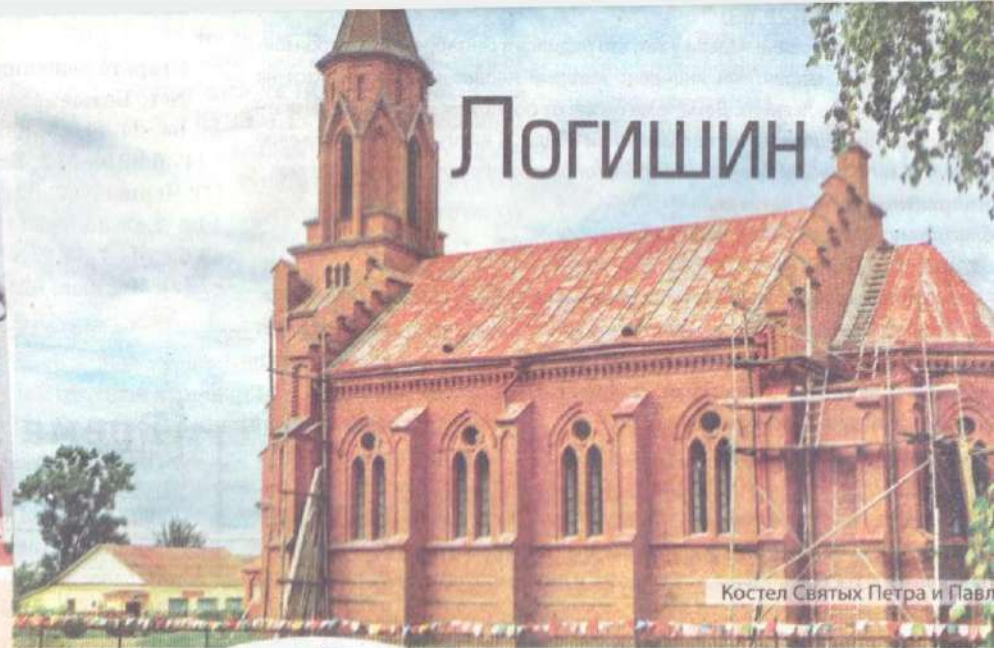
Костел Святых Петра и Павла