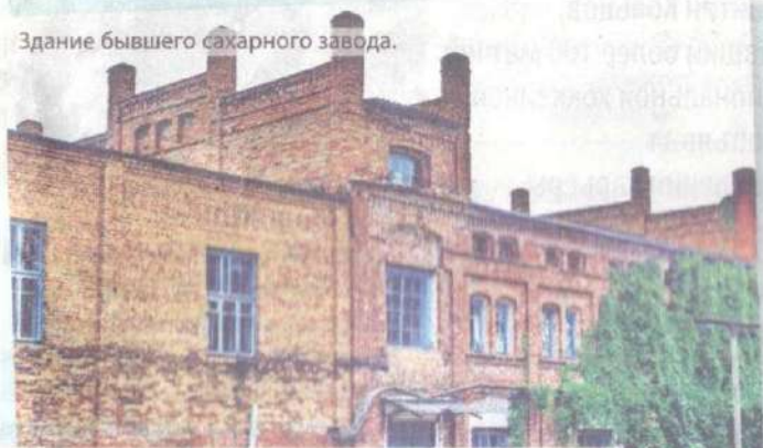
Здание бывшего сахарного завода.

понятно, какое ведомство позволило это архитектурный памятник оштукатурить пластиковым сайдингом, тем самым уничтожив его аутентичность.