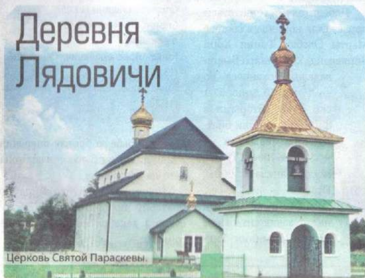
Церковь Святой Параскевы.

Во второй половине XVIII столетия в деревне была возведена деревянная церковь Параскевы Пятницы. В XIX столетии ее частично перестроили. В справочнике «Архитектура Беларуси» она относится к памятникам деревянного зодчества республиканского (!) значения. И совершенно не понятно, какое ведомство позволило этот архитектурный памятник обшить пластиковым сайдингом, тем самым уничтожив его аутентичность.