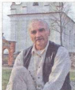
Авторский проект художника, реставратора, путешественника Владимира Цвирко.