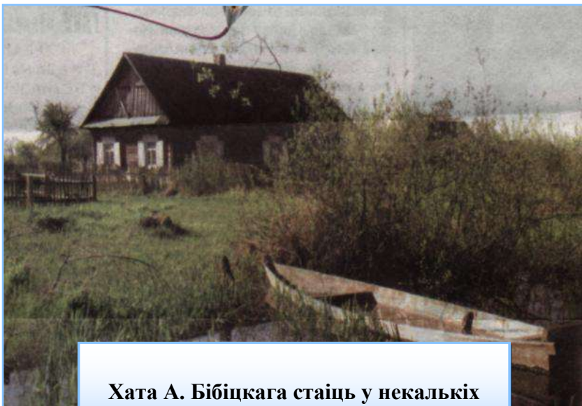
Хата А. Бібіцкага стаіць у некалькіх кроках ад Прыпяці, ля шлюза