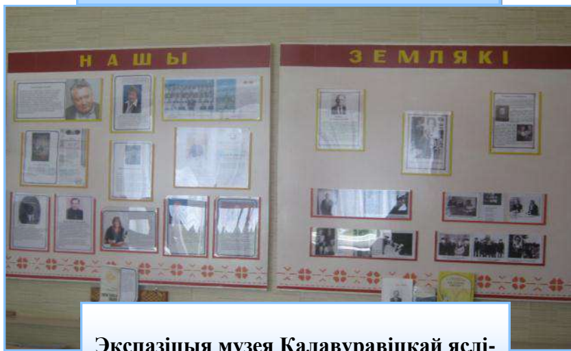
Экспазіцыя музея Калавуравіцкай яслі-сад-сярэдняй школы