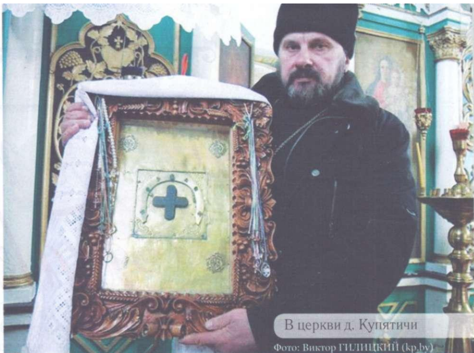
В церкви д. Купятичи

Копии икон с изображением Божией Матери Купятицкой стали весьма популярны в XVII в. не только на наших землях, но и далеко за пределами.